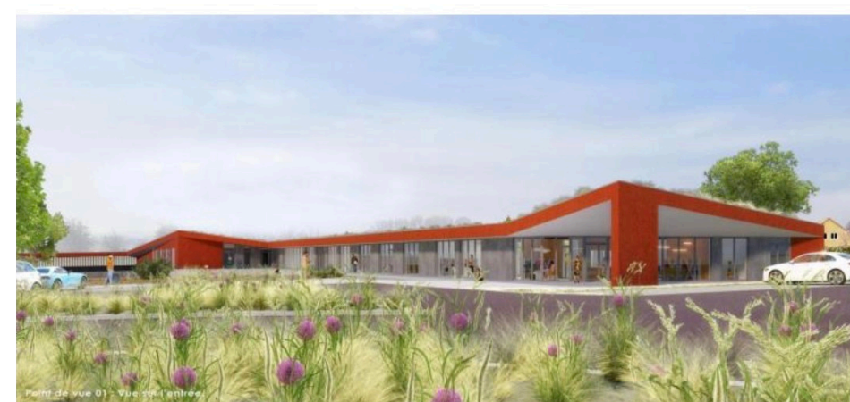
Le futur centre Noréade de Saint-Sylvestre-Cappel (vue depuis le giratoire).

Le 6 mars dernier, a été donné officiellement le coup d'envoi du chantier de construction du nouveau centre sur quatre hectares.